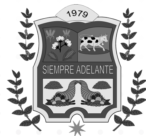
ALCALDÍA DE LA JAGÜA DE IBIRICO